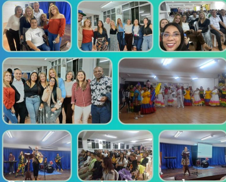
Primer encuentro de egresados 2024